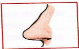
no s e